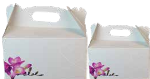
1, 2, 3, 4, 5