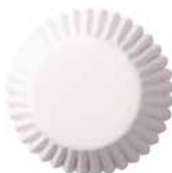
6, 7, 8, 9