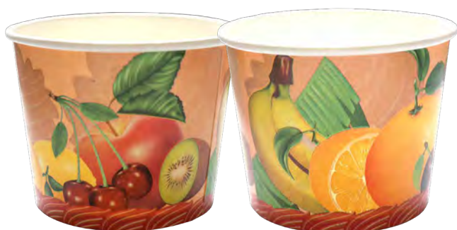
1, 2, 3, 4,