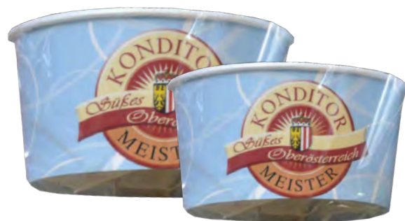
5, 6, 7