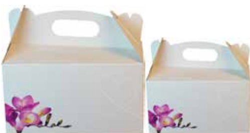
1, 2, 3, 4, 5