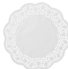
10, 11, 12, 13