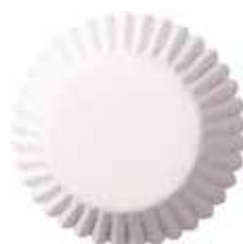
6, 7, 8, 9