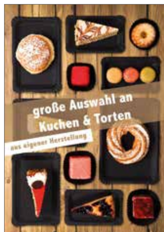
Kuchen & Torten 1