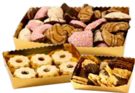
9, 10, 11, 12