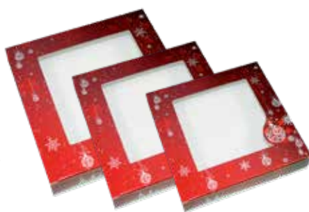
3, 4, 5