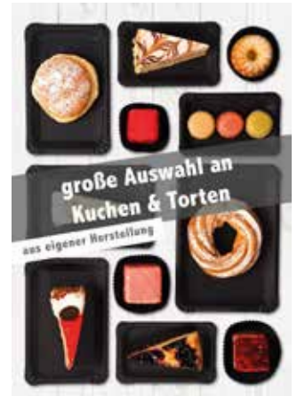
Kuchen & Torten 2